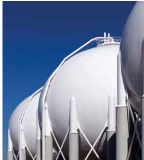
serbatoi di impianti chimici